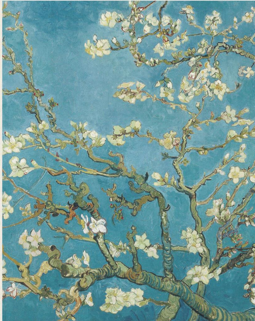
ALMOND BLOSSOM VINCENT VAN GOGH (1890)